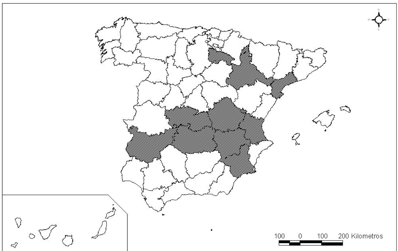
PROVINCIAS CON MÁS DE 25.000 HECTÁREAS DE VIÑEDO DE SECANO (1999)